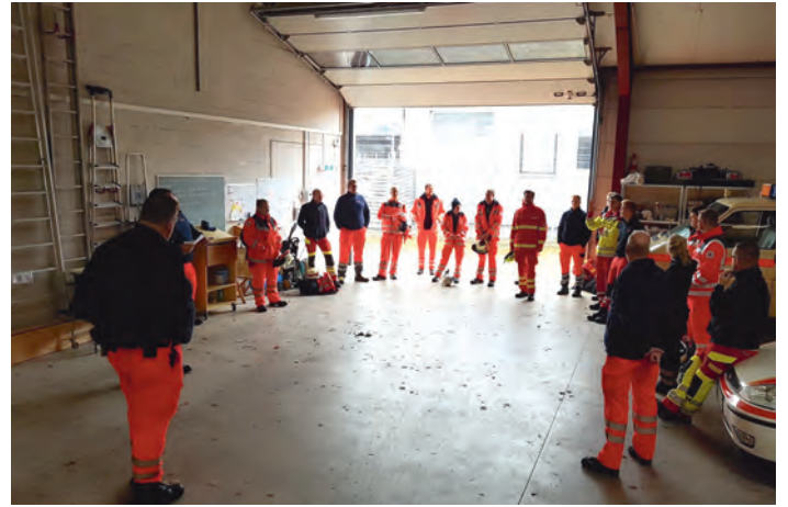
Kirmesbesprechung im Rotkreuzzentrum

Überrascht wurden wir dann von der Durchführung der Allerheiligenkirmes. Das bedeutete für uns, den Dienst in anderer Form durchzuführen. Hier musste zunächst geprüft werden, ob sich genügend ehrenamtliche Helferinnen und Helfer zur Durchführung des Dienstes finden. Dann war ein Hygienekonzept erforderlich, welches nach einem Brainstorming in einer kleinen Gruppe von einem unserer Helfer erstellt wurde. Das beinhaltete, dass wir beispielsweise nur mit der minimal nötigen Anzahl der Helfer den Dienst plantem, 3G Konzept, FFP2 Maskenpflicht im Einsatz, keine Privatbesuche in den Standorten des Sanitätsdienstes auf der Kirmes und der Einsatzleitung im Rettungszentrum.