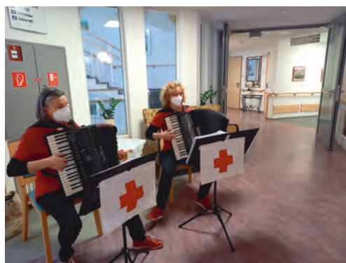
Flurkonzert im St. Antonius Seniorenzentrum